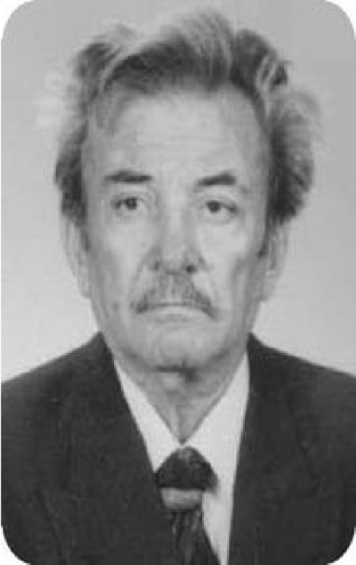
Istırap Kulesi Bir Adam...