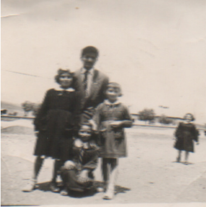
Zarifoglu'nun Pazarcık'ta Öğretmenlik Yaptığı Günler...

“Mustafa gitti sonra” der Zarifoglu ve devam eder; “Sefalet Mustafa” diye tanımladığı Mustafa Özer’i anlatmaya; “Memleketinde bir avuç bahçesini işlemeye başladı. Sağı, solu, böğrü, adaleleri ağrıdı. Çoğu gün yorgunluktan gözüne uyku girmedi. Sonra terzilik yapmaya başladı. Ekmek için. Düşünen fikirlerle dalgalanan bir başın, bir ceket bitirip, bir pantol tamamlayıp, ekmek için, binlerce iğne sokup çıkarması kumaşa... Bir yandan, Fransızcadan tercüme yapması. Yoksul... Düşünen başın kaderi bu, Türkiye’de...”