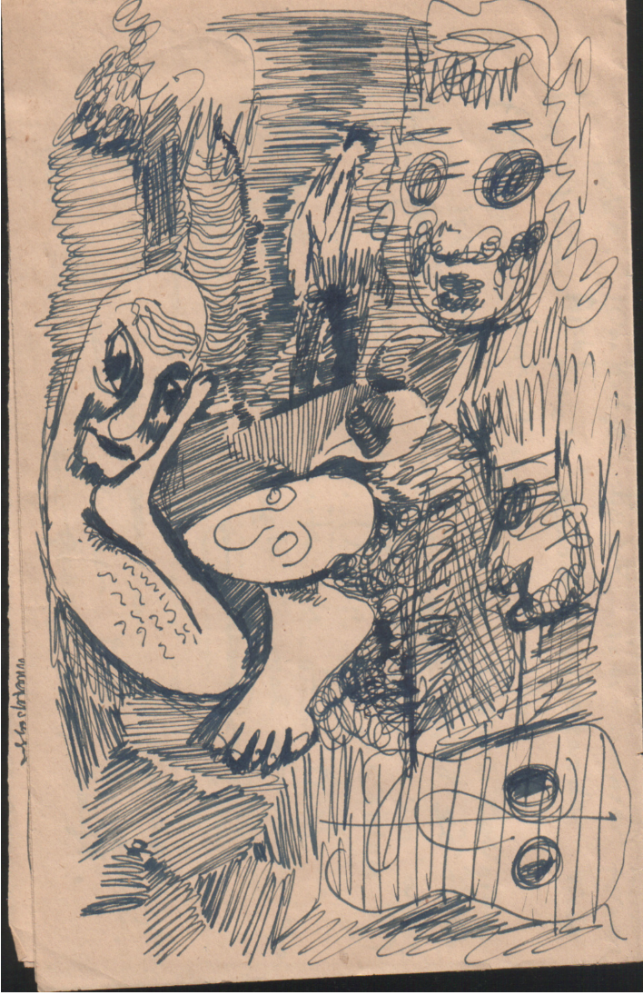
Cahit Zarifoğlu'nun Bir Karakalem Çalışması